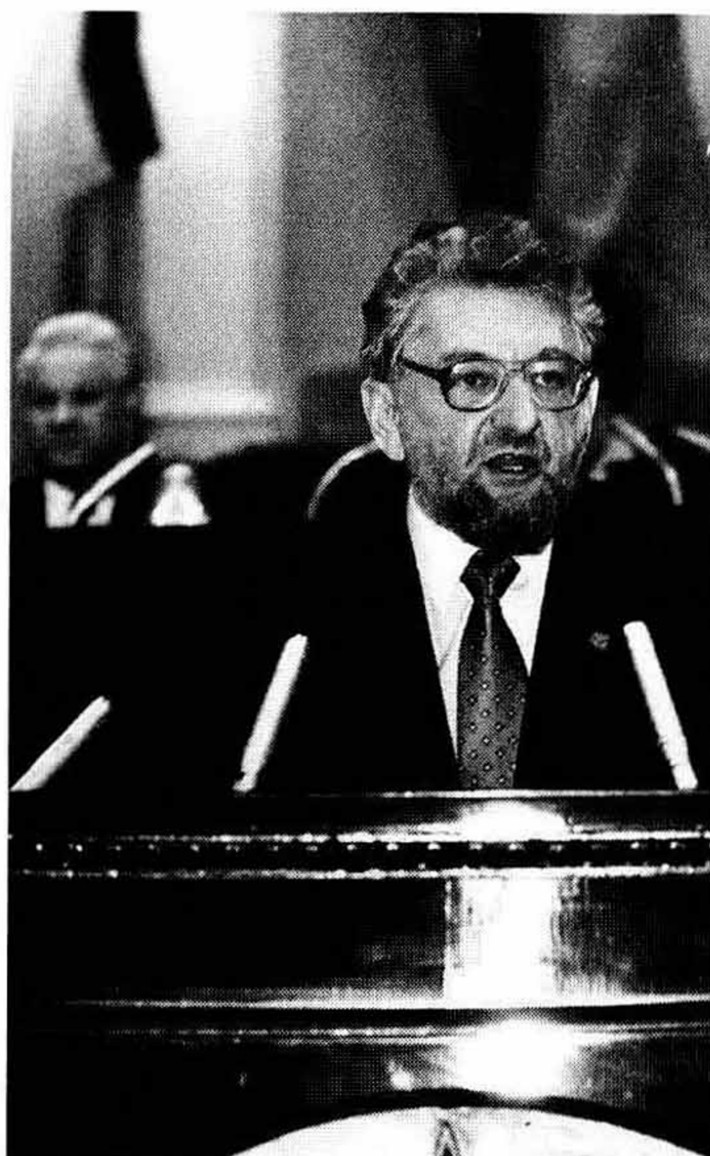
Выступление на III Съезде народных депутатов РСФСР 30 марта 1991 г.

«...Давайте обратимся к реальной ситуации в стране... Демократические организации — это вполне реальная сила. За нами стоят десятки миллионов избирателей. Мы не случайно в этом зале... Давайте сядем за круглый стол и договоримся о том, каким образом власть будет переходить из одних рук в другие руки. Договоримся об этом неотвратимом процессе мирно».