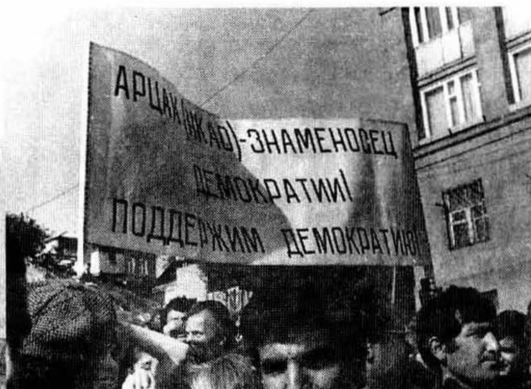
1988 г. Демонстрации в Ереване