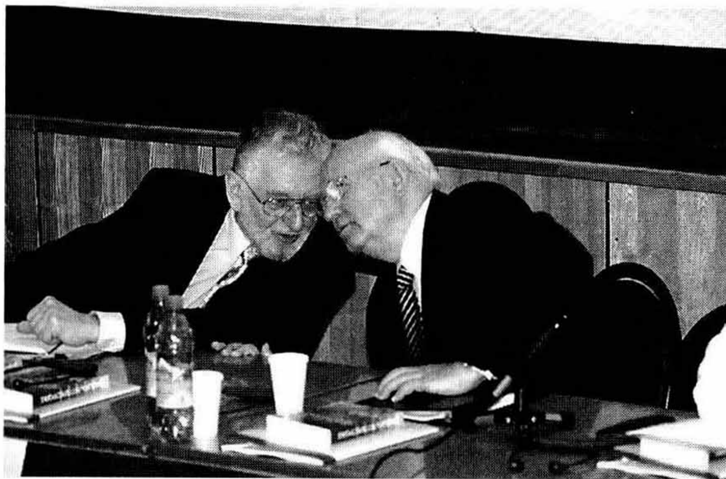
На юбилейной конференции в РГГУ, посвященной 20-летию перестройки