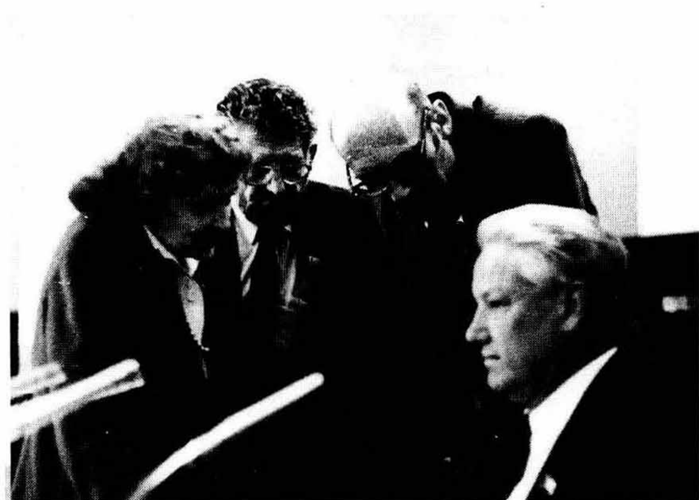
Б. Денисенко, В. Шейнис, М. Челноков, Б. Ельцин

Избрание Ельцина Председателем Верховного Совета РСФСР было обеспечено сочетанием митинга, оркестрованного демократами, и закулисных соглашений. Не сразу и не до конца было понято, что у штурвала встал человек, исполненный решимости соблюдать дистанцию по отношению к выдвинувшим его силам.